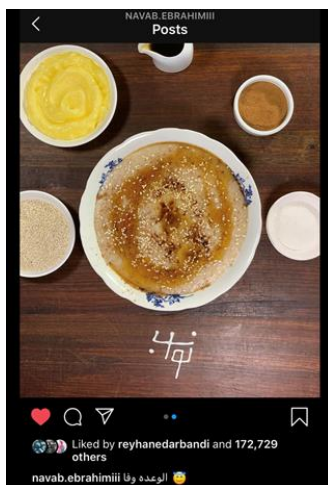
تصویر شماره (۲). طرز تهیه حلیم در یکی از صفحات اینستاگرام (که در سه روز دویست هزار لایک خورد)

به واسطه پویش پخت نان خانگی بود که پس از کمبود ماسک و دستکش و مواد ضدعفونی کننده، کمبود آرد و وایتیل به مهمترین مسئله فروشگاه‌های بزرگ تبدیل شد. پویش پخت خانگی نان در ماه رمضان به پویش پخت خانگی زولبیا و بامیه و حلیم گسترش یافت و اینفلوئنسرهای آشپزی از اقصی نقاط ایران دستورهای خاص مناطق خود را به این پویش جمعی عرضه کردند. هر عکسی که زنان خانه‌دار مجازی از تجربه پخت خود در اینستاگرام و سپس در گروه‌های واتس‌آپی به اشتراک می‌گذاشتند، موتور محرکی بود الهام‌بخش برای زنان بعدی. این پویش پخت نان و زولبیا و بامیه خانگی به مناسک ملی-مذهبی نوین، اشتراکی و خودجودش زنان ایرانی در سراسر ایران و جهان تبدیل شد که در شرایط اندوه‌بار کرونایی، روحیه و امید را از میان خانه‌ها به ایرانیان گسیل کرد.