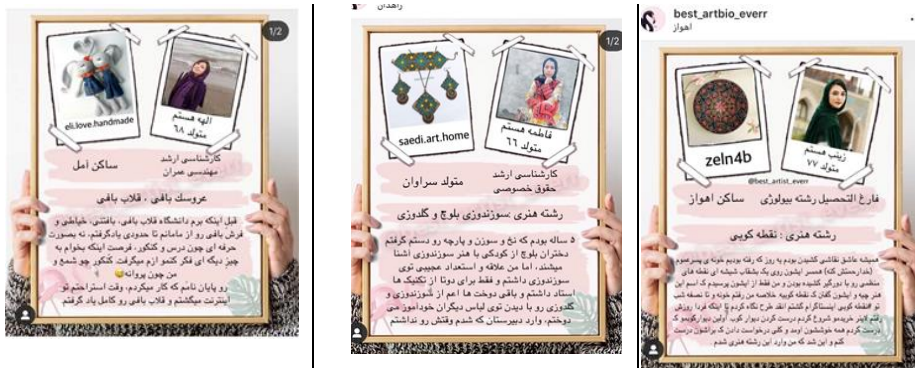
تصویر شماره (۱۵). هنروران اینستاگرامی بازار آلترناتیو مجازی که عمدتاً از زنان جوان هستند.