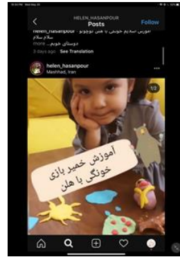
تصویر شماره (۳). طرز تهیه خمیرخانگی در یکی از صفحات اینستاگرام با ۱۶ هزار فالور