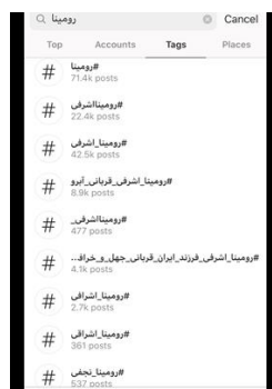
تصویر شماره (۸). فراوانی هشتگ رومینا (تا انتهای خرداد ماه ۹۹)