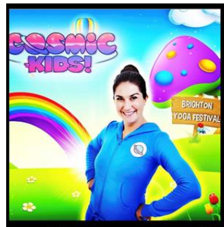
تصویر شماره (۴). برنامه یوتیوبی کازمیک کیدز یوگا