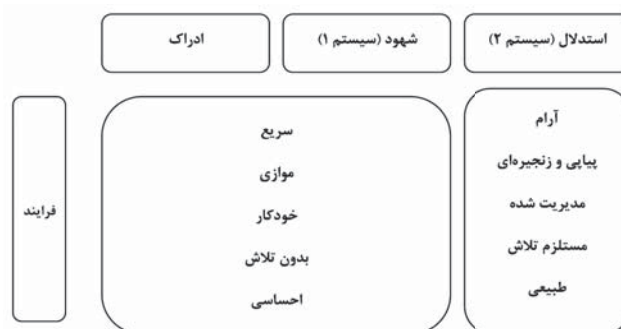
شکل ۱. سیستم‌های شناختی، کانمن، ۲۰۰۲

همواره براساس استدلال عمل کند بلکه در اغلب اوقات براساس سیستم شناختی شهودی عمل می‌کند. (کانمن، ۱ ۲۰۰۳) به بیان بهتر این دو سیستم، شیوه‌های قابل جایگزینی برای حل مسائل پیش‌روی فرد هستند. سیستم اول براساس عادت عمل کرده و بنابراین اصلاح و نظارت بر آن مشکل است؛ در مقابل عملکرد سیستم دوم نسبتاً منعطف و قاعده‌مند است. (کانمن، ۲۰۰۳)