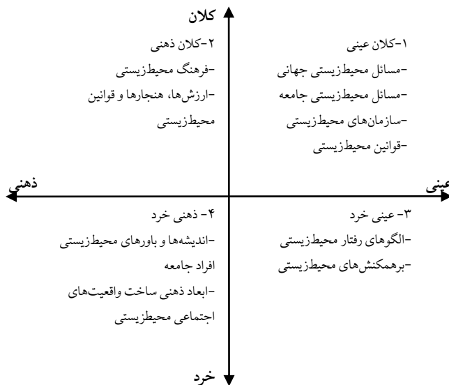
شکل ۳. سطوح عمده پارادایم بر ساختی- تفسیری مسائل محیط‌زیست

دو پیوستار خرد- کلان و عینی- ذهنی بسیار اهمیت داشته و در مطالعات مبتنی بر ساخت مسائل محیط‌زیستی کاربرد بالایی دارند. آنچه در این مقاله به دنبال آن هستیم روابط متقابل این دو پیوستار و ساخت یک الگوی منسجم در مطالعه بر ساخت مسائل محیط‌زیستی است. شکل ۳ این الگو را نشان می‌دهد که از تقاطع دو پیوستار قبلی حاصل شده و چهار سطح واقعیت‌های اجتماعی را نشان می‌دهد.