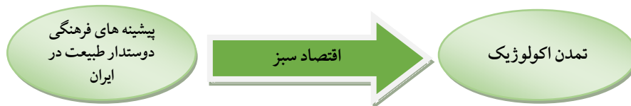
شکل ۱. چگونگی گذار به تمدن اکولوژیک از گذرگاه اقتصاد سبز

اقتصاد سبز می‌تواند به عنوان پیشران تمدن اکولوژیک و در راستای تحقق اهداف آن به کار گرفته شود. بخش اعظم اقتصاد جهانی بر پایه اقتصاد قهوه‌ای استوار است و گذر از اقتصاد قهوه‌ای به اقتصاد سبز، با حداقل آسیب به رشد اقتصادی، یکی از بزرگ‌ترین دغدغه‌های کشورهای است. موانع توسعه اقتصاد سبز در کشورهای در حال توسعه دو جنبه دارد: اول، گذار از اقتصاد قهوه‌ای به اقتصاد سبز نیازمند سرمایه‌گذاری اولیه است که بسیاری از این کشورها توان مالی لازم را ندارند؛ دوم، اقتصاد سبز نسبت به اقتصاد قهوه‌ای دیر بازده‌تر است، هر چند میزان بازدهی و حفاظت از منابع طبیعی، جبران این تأخیر را ممکن می‌سازد. ادامه روند رشد اقتصاد قهوه‌ای نه تنها منجر به تهی شدن منابع طبیعی و رشد ناپایدار می‌شود، بلکه کشورهای را از حداقل‌های لازم برای دستیابی به اقتصاد سبز دور می‌کند. بنابراین، گذار از اقتصاد قهوه‌ای به اقتصاد سبز یک ضرورت است و عدم تحقق آن در آینده، دستیابی به توسعه پایدار و تمدن اکولوژیک را دشوار خواهد کرد (آژانس بین‌المللی انرژی ۱ ، ۲۰۲۲).