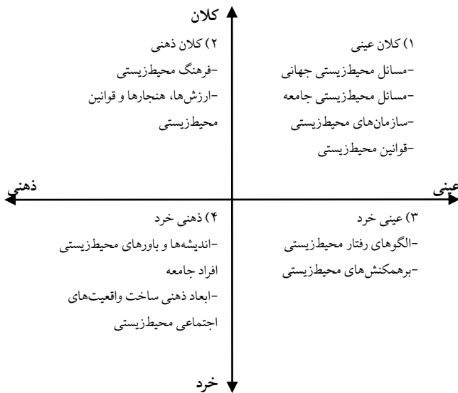
شکل ۳. سطوح عمده پارادایم بساختی- تفسیری مسائل محیط‌زیست

دو پیوستار خرد- کلان و عینی- ذهنی بسیار اهمیت داشته و در مطالعات مبتنی بر بساخت مسائل محیط‌زیستی کاربرد بالایی دارند. آنچه در این مقاله به دنبال آن هستیم روابط متقابل این دو پیوستار و ساخت یک الگوی منسجم در مطالعه بساخت مسائل محیط‌زیستی است. شکل ۳ این الگورا نشان می‌دهد که از تقاطع دو پیوستار قبلی حاصل شده و چهار سطح واقعیت‌های اجتماعی را نشان می‌دهد.